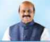
ಶ್ರೀ ಬಸವರಾಜ ನಾಯ್ಕ ಬೊಮ್ಮಾಯಿ ಕನ್ನಡ ಮತ್ತು ಸಂಸ್ಕೃತಿ ಇಲಾಖೆ ಕಾರ್ಯದರ್ಶಿ