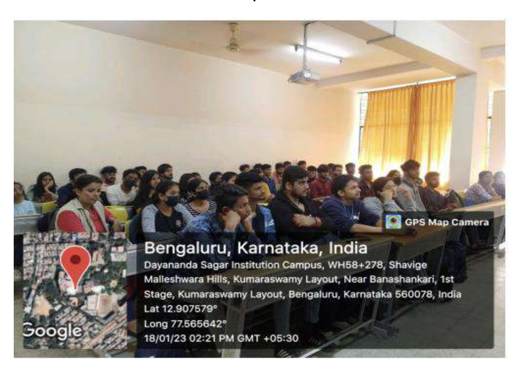
3. All 3<sup>rd</sup> SEM Kannada Students