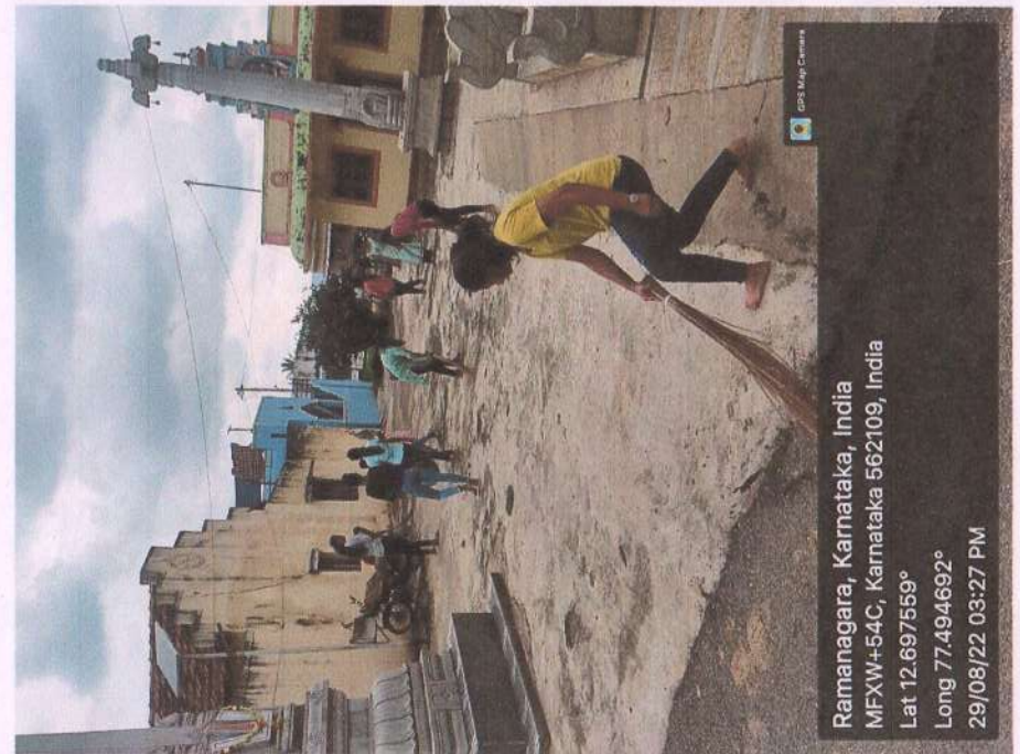
Ramanagara, Karnataka, India MFXW+54C, Karnataka 562109, India Lat 12.697559° Long 77.494692° 29/08/22 03:27 PM