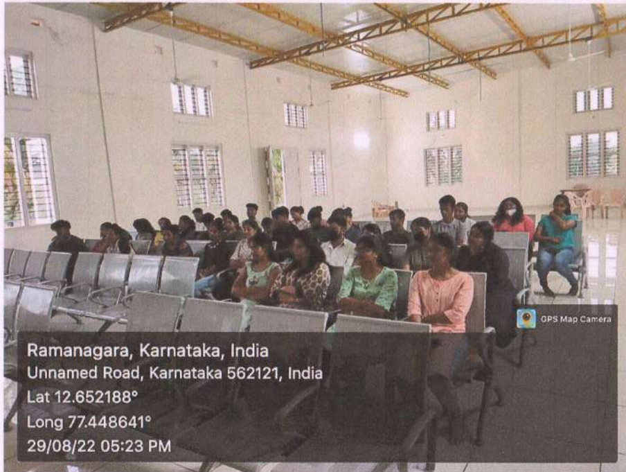
Ramanagara, Karnataka, India Unnamed Road, Karnataka 562121, India Lat 12.652188° Long 77.448641° 29/08/22 05:23 PM