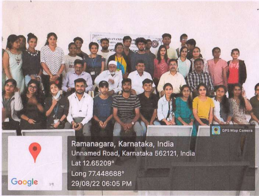
Ramanagara, Karnataka, India Unnamed Road, Karnataka 562121, India Lat 12.65209° Long 77.448688° 29/08/22 06:05 PM